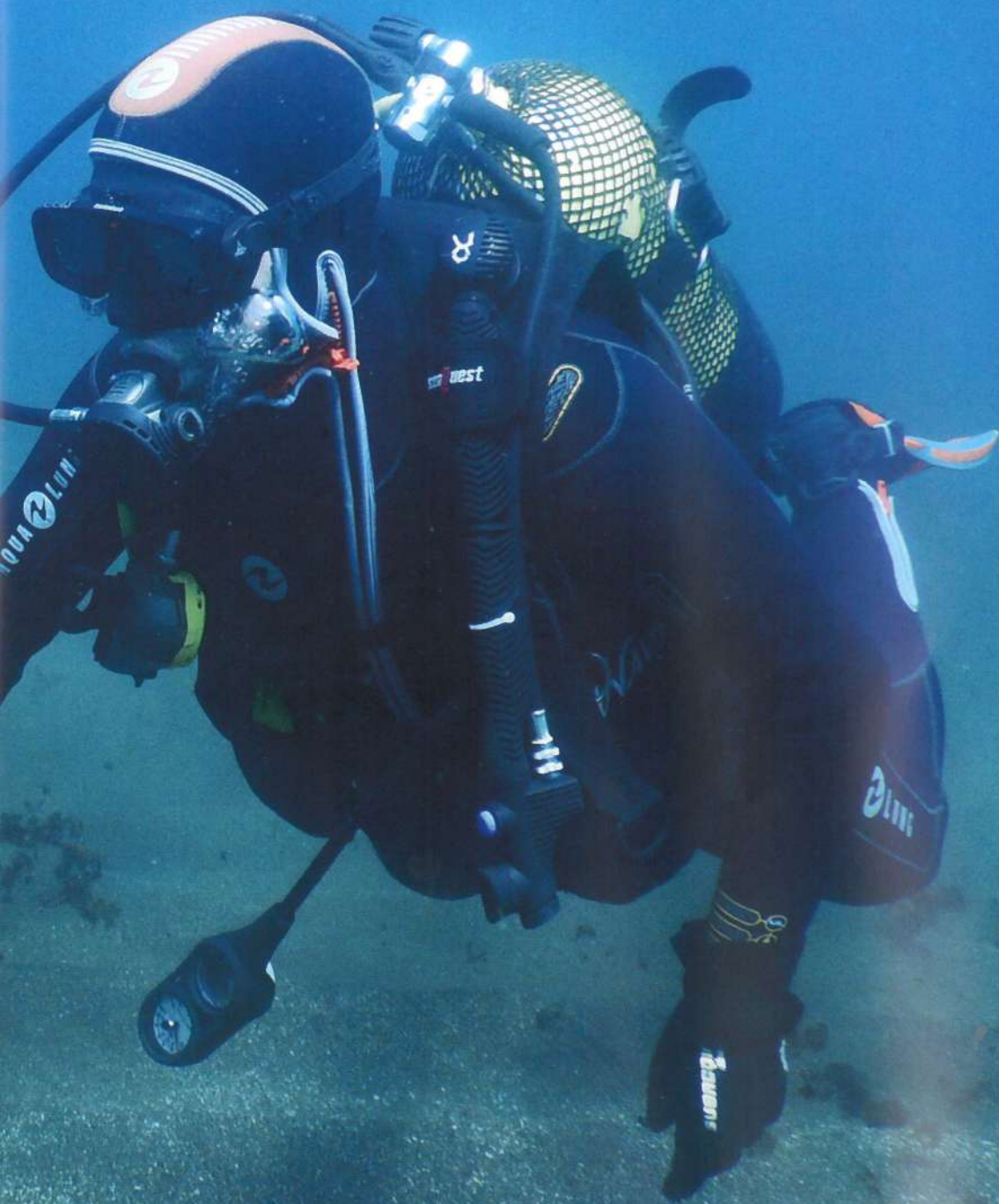
Naufração do Lidador , ilha Terceira.

La Dirección Regional de Cultura de las Azores puso a disposición, en 2019, el Manual de Buenas Prácticas del Patrimonio Cultural Arqueológico Subacuático de las Azores . Este es un trabajo complementario al trabajo de gestión en curso llevado a cabo por el Gobierno Regional con respecto a un conjunto de restos visitables en la región que se publicaron por primera vez en la Ruta Turística del Patrimonio Cultural Subacuático de las Azores , en 2017. Este itinerario turístico presentó 30 sitios arqueológicos subacuáticos, con buenas condiciones para la visita del público en general, asumiéndose como una herramienta de promoción de este archipiélago, como un destino turístico de buceo por excelencia.