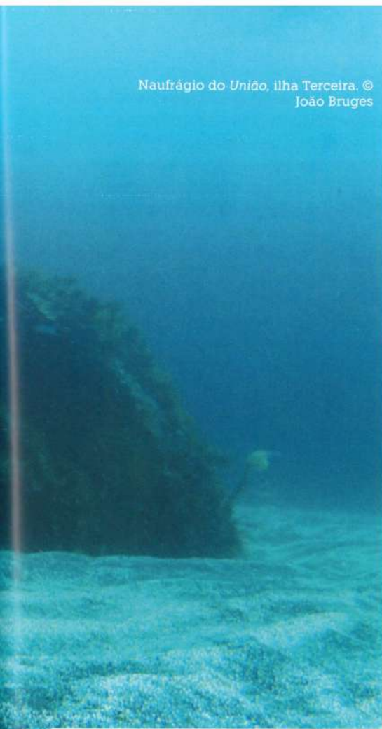
Naufração do União, ilha Terceira.

salvaguardando el patrimonio y el interés natural de los sitios en cuestión, basado en el Código de Ética del Patrimonio Cultural Subacuático de la UNESCO, un documento esencial para los profesionales.